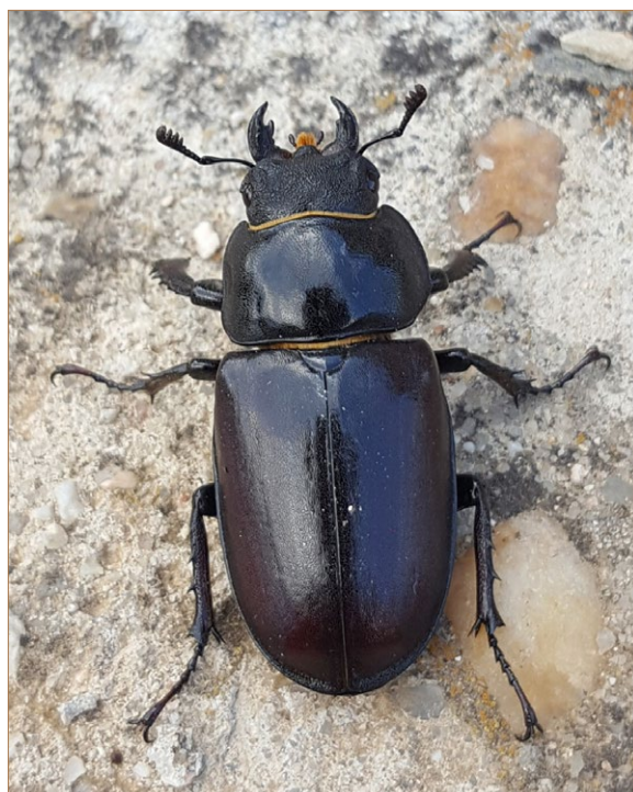
Foto 10. Lucanus cervus . Horcajo de La Sierra.