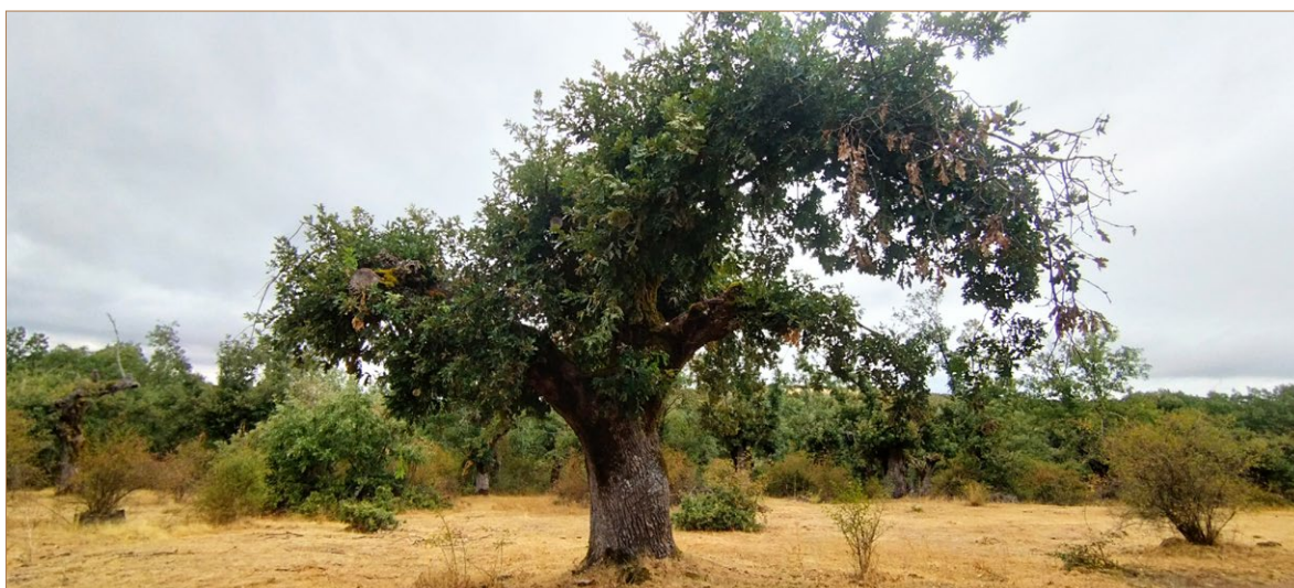
Foto A7. Roble trasmucho tras una poda reciente. Palazuelos de La Sierra.