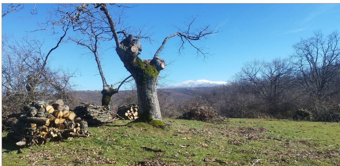
Foto 7. Dehesas vecinales en Villasur de Herreros (Burgos), Piñuela, tras un aprovechamiento reciente de leñas.

La enorme extensión actual de los montes adehesados en la península ibérica así como la constancia de su aún mayor extensión en el pasado, nos lleva a pensar que el modelo de gestión y aprovechamiento que subyace a sus orígenes responde a una realidad social que emerge con gran fuerza en unas circunstancias históricas concretas y se expande por toda la Península Ibérica.