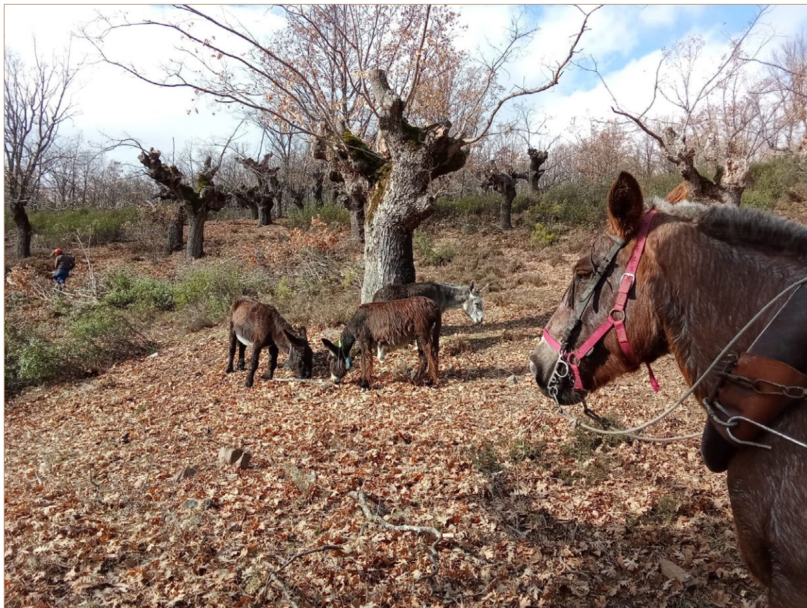
Foto B2. Apacentamiento de ganado equino. Puebla de La Sierra.

La trasmisión oral de los saberes de los mayores orientó la labor de los nuevos pobladores y su percepción sobre el paisaje en tremenda mutación del municipio. Alumnado de distintas universidades han pasado a lo largo de estos años para hacer interpretaciones del paisaje y reflexionar con los locales sobre todos los aspectos socioambientales puestos en juego.