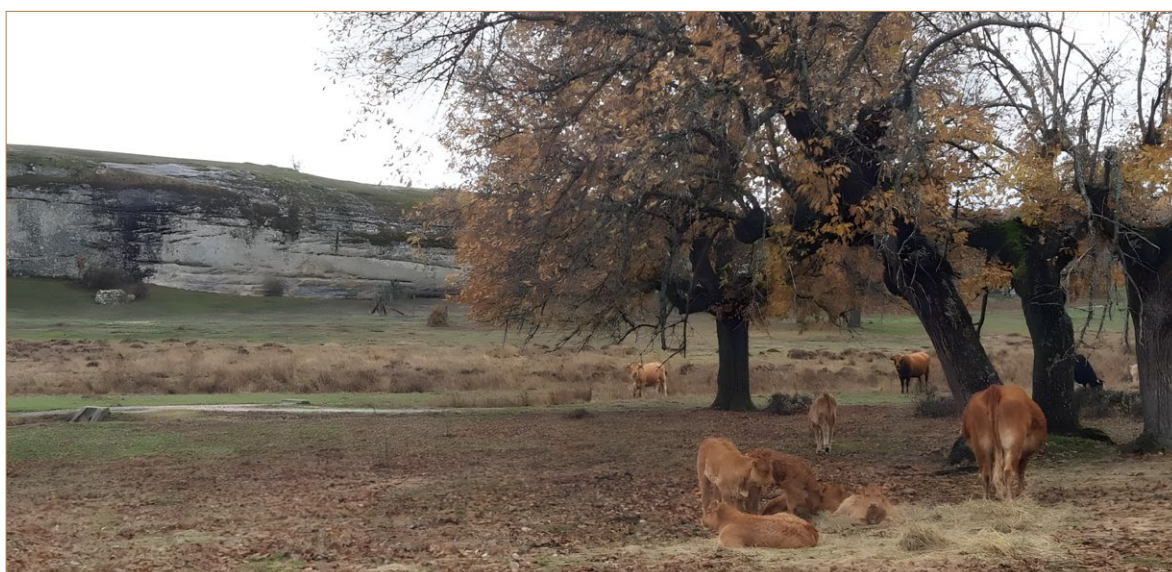
Foto 5. Dehesas de robles trasmochos con aprovechamiento ganadero en Hacinas (Burgos).

El tratamiento de los árboles de esta forma tiene muchas ventajas en estos territorios y climas, razón por la que se ha mantenido esta práctica durante siglos hasta nuestros días. Los trasmochos son muy funcionales para los sistemas productivos campesinos locales. Sobre todo, por estar en general en territorios agrícolamente poco productivos y ser culturas muy asociadas a la ganadería y, como hemos dicho, dependientes energéticamente de la leña y el carbón vegetal para calentarse, cocinar y utilizar los hornos, fraguas o tejas.