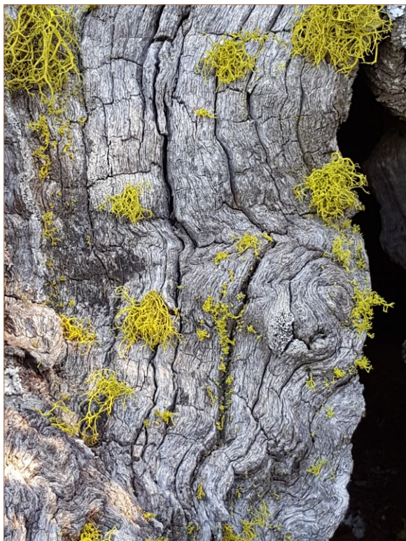
Foto 11. Letharia vulpina . Viejo roble muerto.