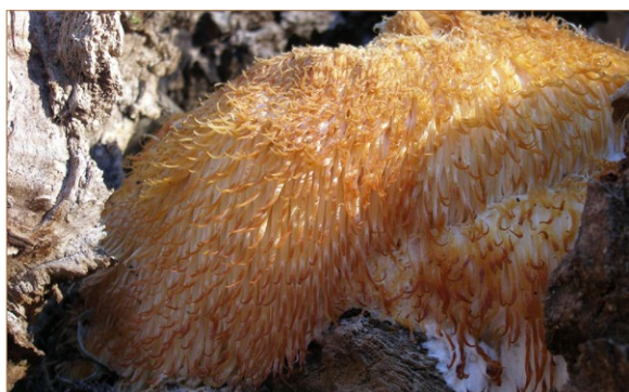
Foto 9. Hericium erinace.

cos y retorcidos. Sus oquedades ofrecen refugio y lugares de cría a aves y mamíferos. Muchas de las especies de todos los reinos ligadas a estos árboles viejos son escasas y no generalistas y dependen de su presencia como hongos, coleópteros o murciélagos forestales.