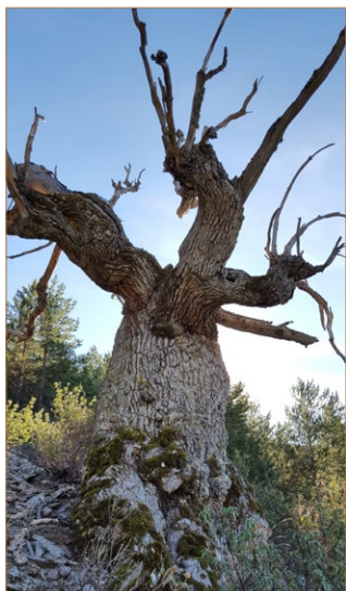
Foto 13. Melojo seco. Puebla de La Sierra.