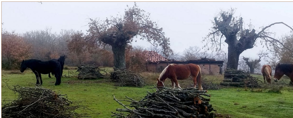
Foto 6. Majadas del Matorro, Úzquiza.

«[...] Vemos y veíamos cada año que se renovaba las ramas del roble estaba más vivo»