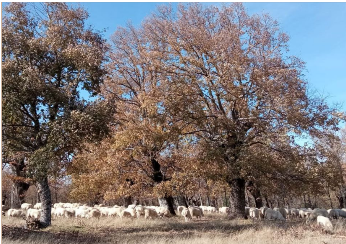
Foto 17. Pastoreo de ovejas churras en las dehesas vecinales de Villasur de Herreros (Burgos).

El arraigo que requiere el cuidado de animales contrasta con la hipermovilidad de la sociedad actual. La falta de relevo en lo que aún queda de ganadería extensiva se ve dificultada por el círculo vicioso del abandono.