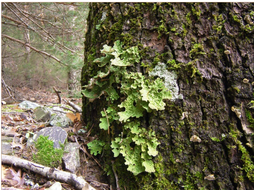
Foto 14. Lobaria pulmonaria. Puebla de La Sierra.