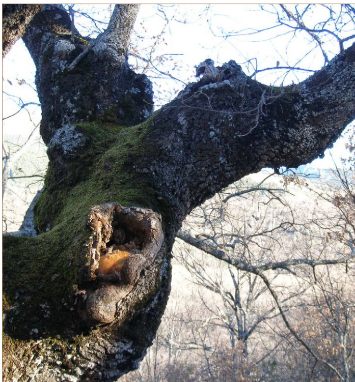
Foto 16. Hericium erinace . Huevo en herida de desgarro.