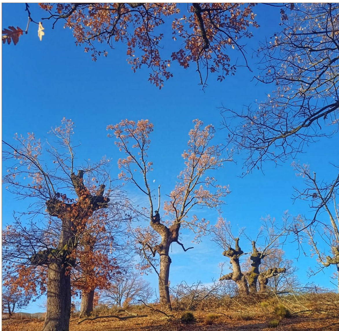
Foto 4. Robles ramoneados en La Mata del Cabo, Puebla de La Sierra.

Las técnicas de poda varían según la respuesta de cada especie al tratamiento y el objetivo de las mismas. En el caso de los robles, dan lugar a formaciones de copa distintas dependiendo del estado del árbol en la poda inicial, la densidad de pies, el objetivo de la poda e incluso la habilidad del podador para trepar. Existen tipologías y estructuras diferentes de robles, pero siempre son muy diferentes a los árboles «bravos», llamados rebollos o matorros .