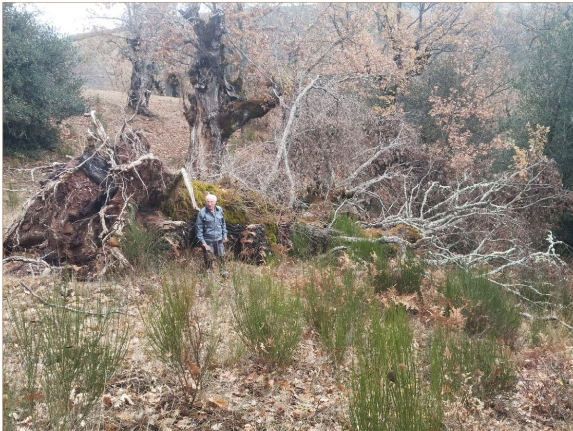
Foto A8. Majestuoso ejemplar de roble caído víctima del abandono en las dehesas de Tolbaños de Abajo.