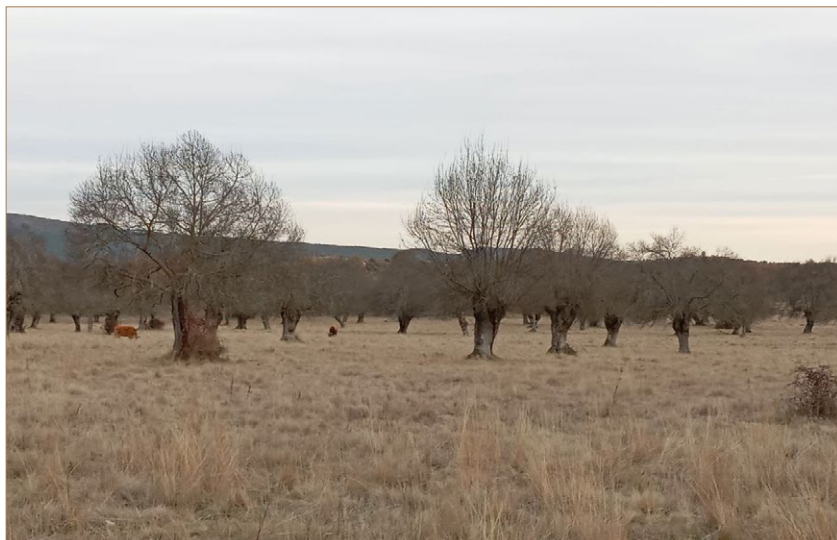
Foto 1. Dehesa boyal de fresnos trasmochos de El Berrueco. Madrid.

Trasmochos, dehesas y comunales: claves para inspirar futuros