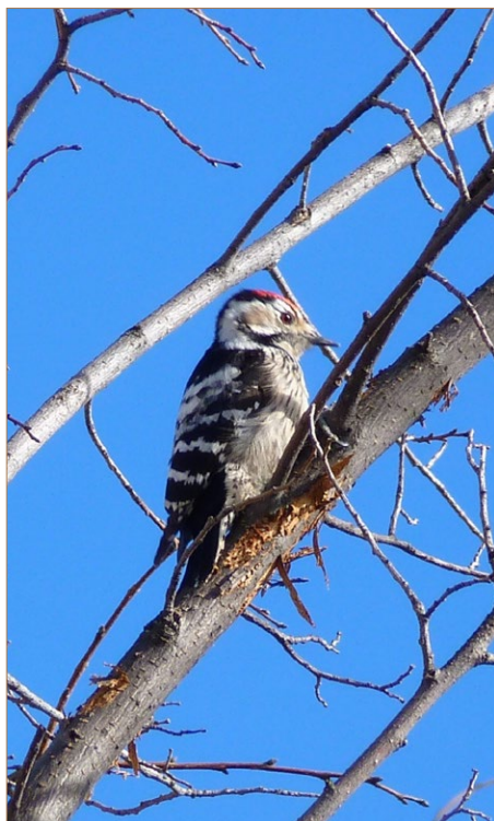
Foto 15. Pico menor. Horcajo de La Sierra.