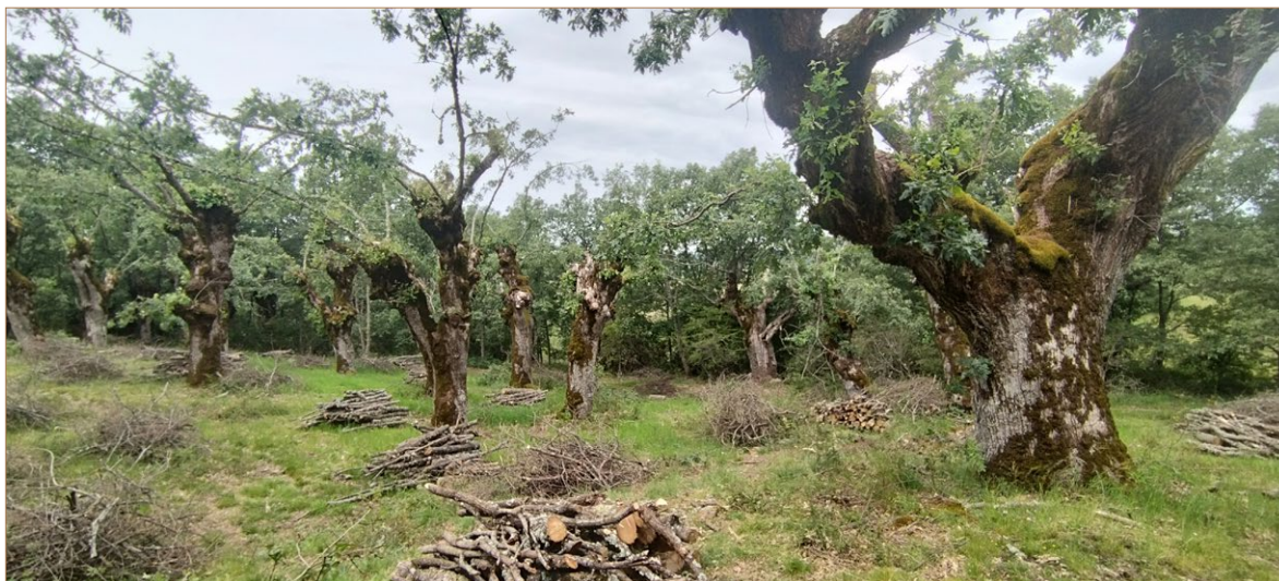
Foto A4. Aprovechamientos de leña de poda en Urréz.

ma, se amontona en barderas en el propio monte y se trocea a la medida de cada hogar. En general se deja secar durante el verano antes de bajarla al pueblo. En otras ocasiones se baja «en largo» y se deja en barderas en alguna era o solar antes de trocearla, rajarla en su caso, y guardarla en un pajar o almacén.