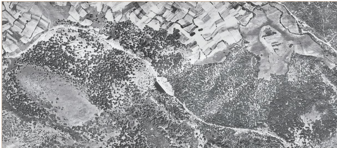
Foto A1. Dehesas de roble en el monte Gustares, año 1956. Villasur de Herreros.