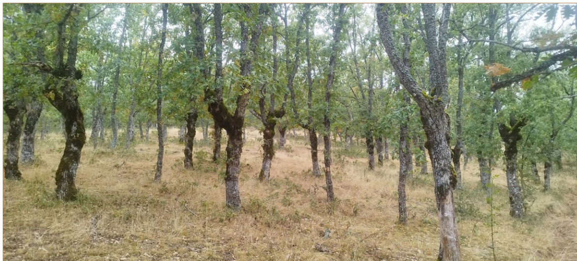
Foto A5. Adehesamiento de mediados del siglo XX con trasmochos jóvenes abandonados pasados de turno en la zona Palazuelos. Obsérvese la competencia con los nuevos pies de rebollo.