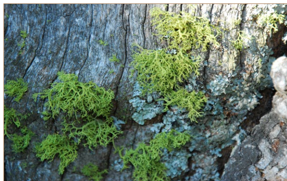
Foto 12. Letharia vulpina . Viejo roble muerto.