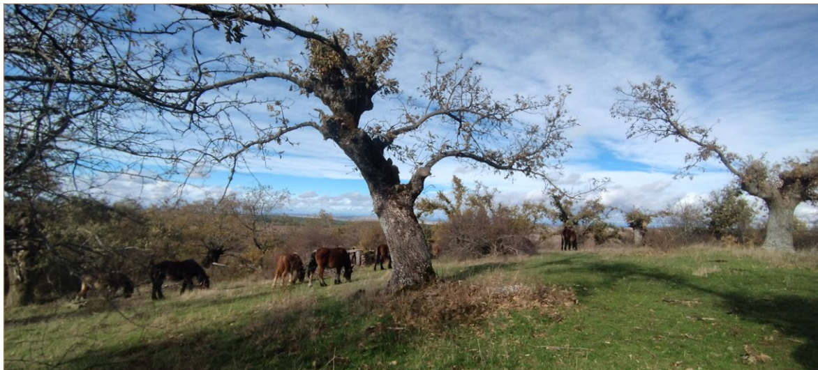
Foto A2. Majada adehesada en La Piñuela. Villapur de Herreros.

que implica una intervención más laxa de la administración supralocal en su gestión, si bien proceden igualmente de la anterior masa de patrimonio comunal.