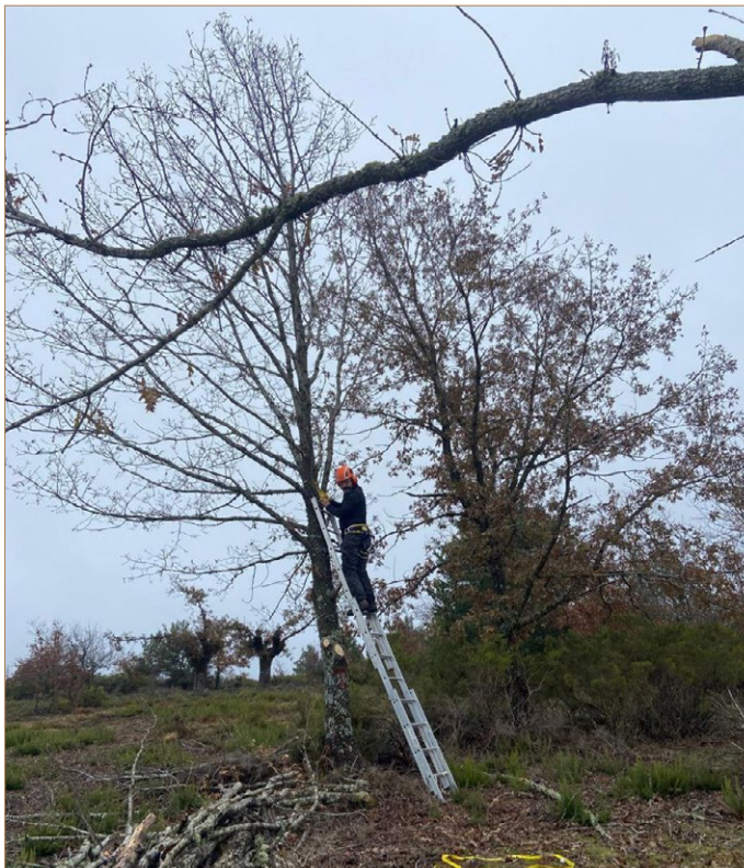
Foto A5. Aprovechamientos de leña de poda en Urréz.

Los adehesamientos acometidos durante el siglo XX en los montes vecinales de nuestros pueblos lo fueron por iniciativa de los concejos, juntas vecinales o ayuntamientos, según el caso, ya con la intervención de la guardería forestal. En otras ocasiones, los propios paisanos formaban los robles que consideraban oportuno en el entorno donde se efectuaban los aprovechamientos de leñas vecinales, renovando o aumentando así la masa de trasmochos.