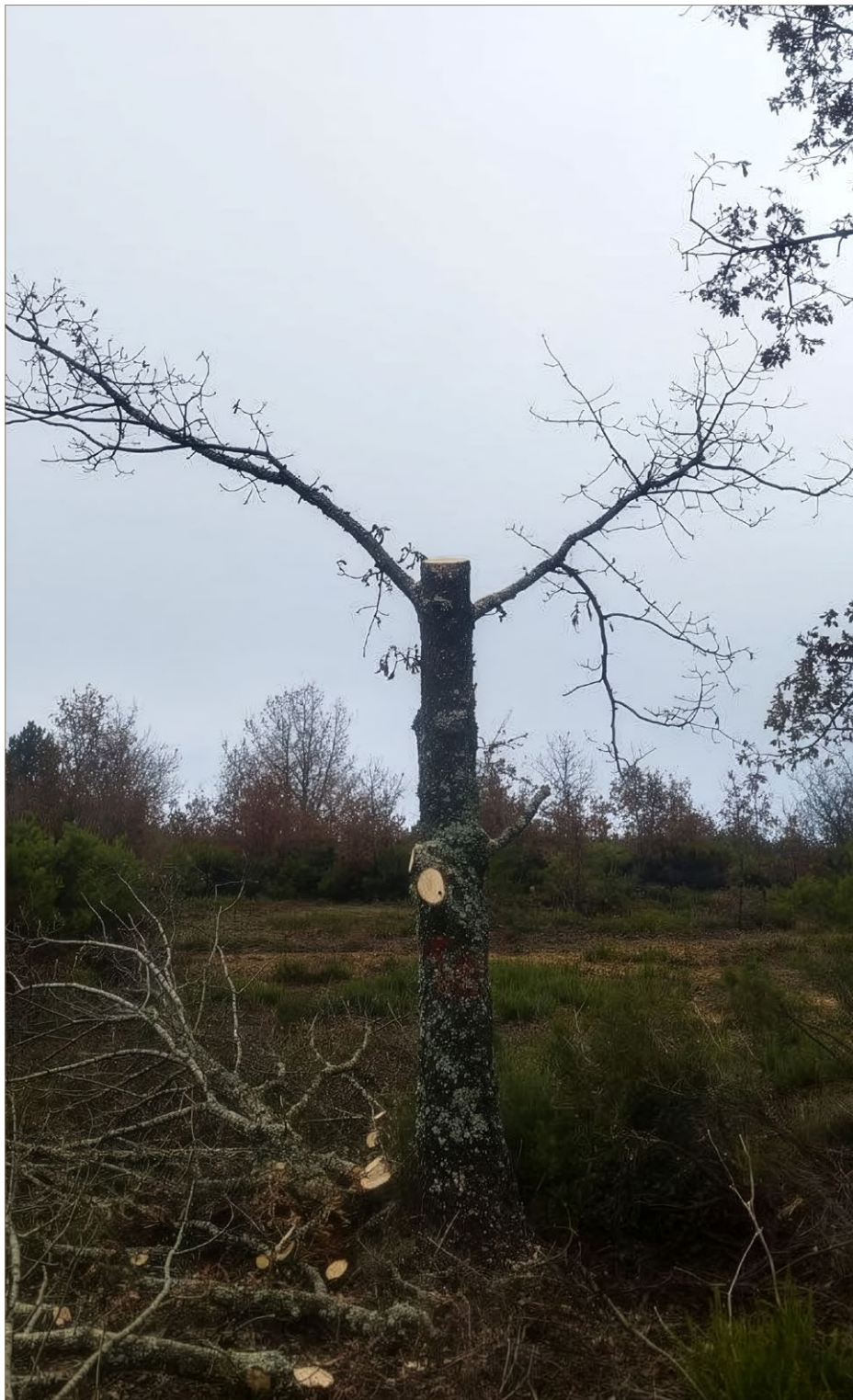
Foto 18. Formación de un nuevo trasmochos de roble. Villasur de Herreros (Burgos).