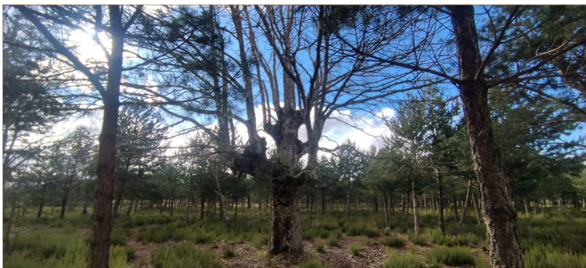
Foto A3. Competencia del pinar introducido con los viejos trasmucho. Obsérvese cómo el desbroce entorpece el crecimiento del pasto favoreciendo el rebrote del brezal. Úzquiza.